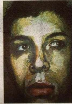
Obsession-Kate Moss, 2006

Sul perché Urban abbia ispirato l'asinello di Cattelan carico dell'orinatoio di Duchamp, che Maurizio Carriero ha dipinto in Cattelan vs Duchamp Urban Contest , non azzardiamo ipotesi e lasciamo il terreno ai critici. Noi ci limitiamo a essere onorati che il ventiseienne artista vincitore del nostro premio all'interno del concorso di Italian Factory per giovani pittori, ci abbia "dedicato" l'opera. Poi, non abbiamo resistito. Ficcanasando nel suo archivio, fra arte sacra, citazioni di ready made e ritratti, abbiamo trovato l'inconueta Obsession-Kate Moss per la copertina di questo numero, da ammirare dal vero nella galleria Spazioimmostra (in via Cagnola 26) dal 15 settembre al 13 ottobre, all'interno della collettiva 15 volte 1 volto . Un consiglio dell'autore? Guardate il quadro (o la cover) ascoltandovi Hoppipolla dei Sigur Rós. Per tutte le altre curiosità: www.mauriziocarriero.it , mauriziocarriero@katamail.com .