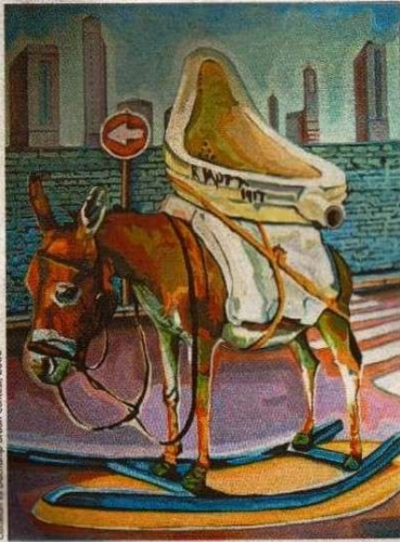
Cattelan vs Duchamp Urban Contest, 2006